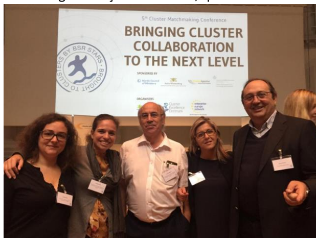
ACPMR – ASSOCIAÇÃO CLUSTER PORTUGAL MINERAL RESOURCES

Os resultados desta participação foram traduzidos na formalização de parcerias europeias e na adoção de algumas boas praticas na governação do Cluster, que foram transmitidas durante este Evento.